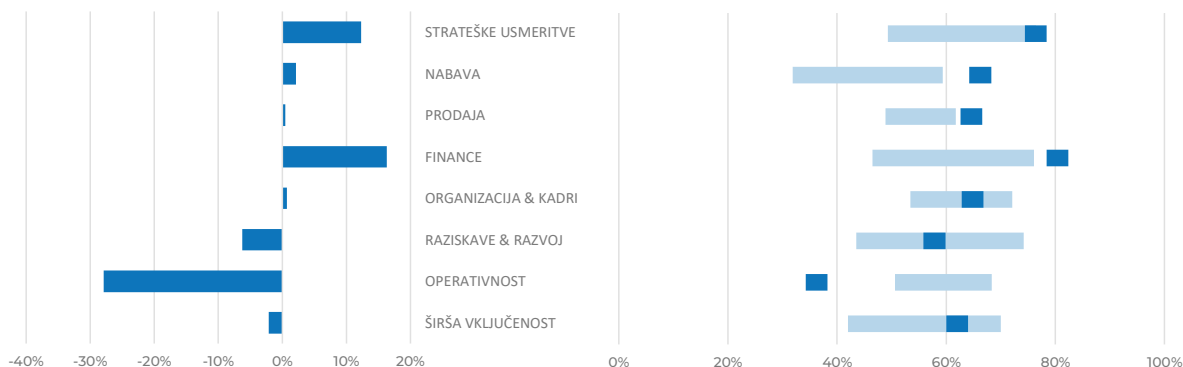
Doseganje podjetja glede na 1. in 3. kvartil vseh

Na odpornost vpliva več indikatorjev. Na zgornjem grafu je prikaz razdeljen po področjih. Vse, kar je negativno, znižuje odpornost. Vse, kar je pozitivno, izboljšuje odpornost. NASVET: osredotočite se na področja, na katerih najbolj negativno odstopate od povprečja.